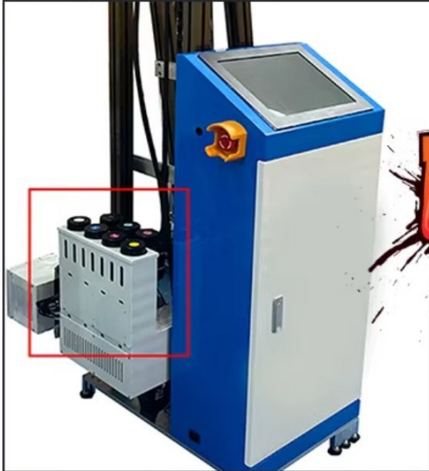
Ο εκτυπωτής μας